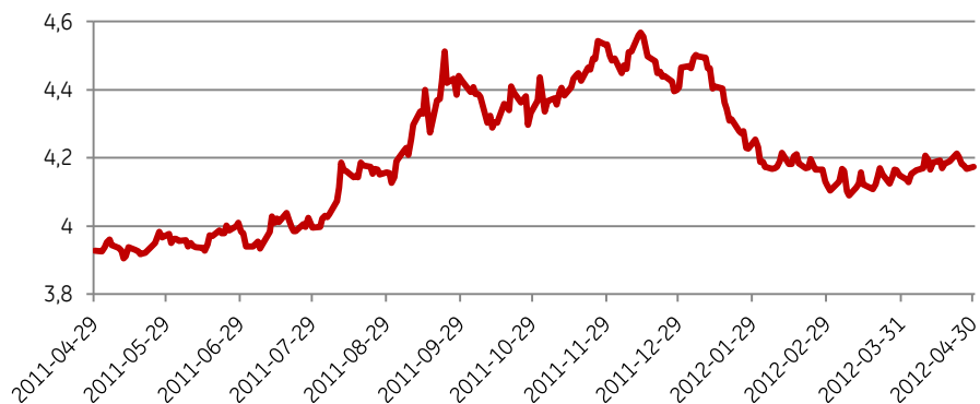
Wykres 2. Kurs EUR/PLN

spowodowały przecenę złotego, były dwojakiej natury. Po pierwsze, globalne nastroje na rynkach finansowych uległy pogorszeniu na skutek coraz większej liczby symptomów ochładzania się koniunktury na świecie (strefa euro, Chiny, a ostatnio i USA) oraz powracających obaw o finansową kondycję gospodarek strefy euro. Po drugie, publikowane w kwietniu dane dotyczące kondycji polskiej gospodarki były również gorsze - dane o deficycie na rachunku obrotów bieżących zaskakiwały negatywnie już trzeci miesiąc z rzędu, a dane dotyczące produkcji przemysłowej były najgorsze od jesieni 2009 roku.