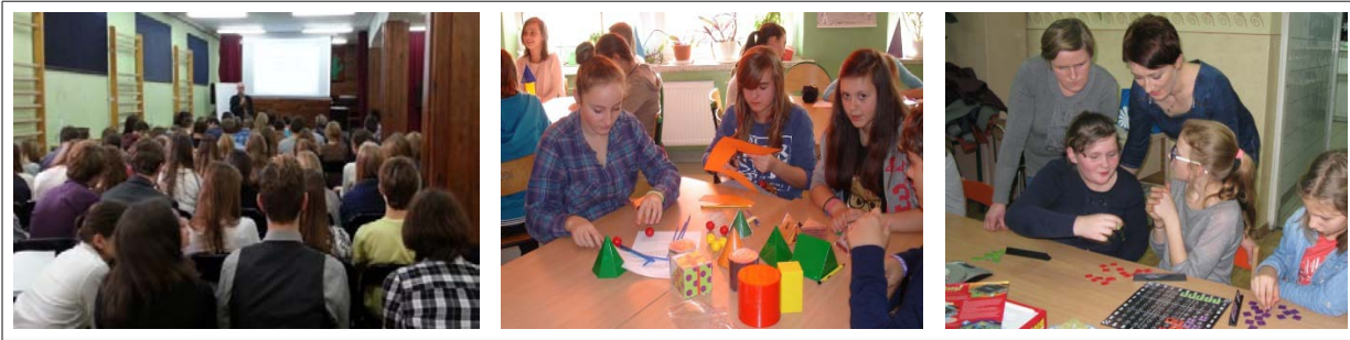
Fot. (od lewej): 1. XXI LO im. Bolesława Prusa w Łodzi, projekt „Językiem matematyki został opisany świat”. 2. Publiczne Gimnazjum nr 5 w Radomiu, projekt „Polubić matematykę”. 3. SP im. Marii Konopnickiej w Mastowicach, projekt „Rodzinne spotkania z matematyką”.