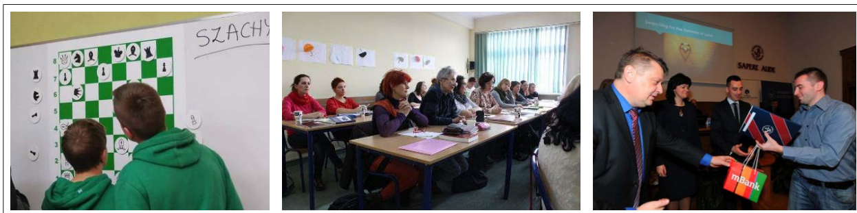
Fot. (od lewej): 1. ZHP Bierutów, warsztaty szachowe prowadzone w ramach projektu „Myśl twórczo – matematyczno-przyrodniczy kapitał” 2. Akademia Pedagogiki Specjalnej, wykład w ramach studiów podyplomowych 3. Uniwersytet Szczeciński, laureat konkursu „Matematyka w obiektywie” odbiera nagrodę.