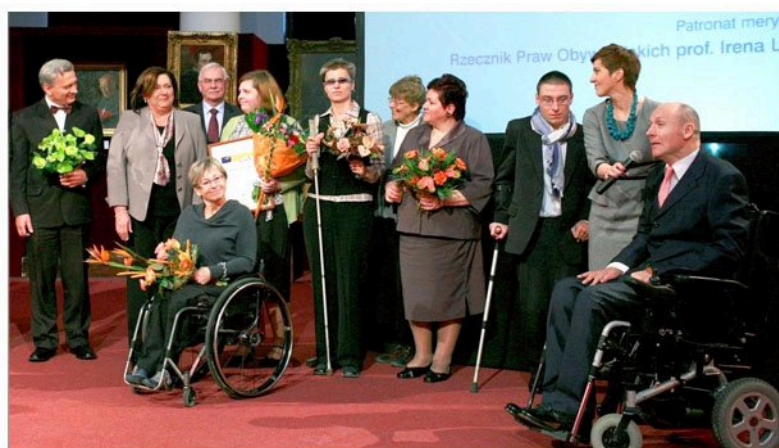
Gala IX Konkursu „Człowiek bez barier”

Projekt „Człowiek bez barier” jest realizowany od 2003 roku. Intencją organizatorów jest nagradzanie osób z niepełnosprawnością, które odnoszą sukcesy w różnych dziedzinach życia zawodowego i społecznego, są przedsiębiorczy, niosą pomoc innym oraz przełamują stereotypowy wizerunek osób z niepełnosprawnością. Ponadto, dzięki przedsięwzięciu upowszechniana jest wiedza o możliwościach tkwiących w osobach z niepełnosprawnością.