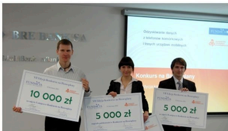
Laureaci Konkursu na Biznesplany w 2011 roku

Wszyscy wybrani rozpoczynają realizację swoich pomysłów pod skrzydłami AIP, co gwarantuje między innymi bezkosztowe prowadzenie działalności gospodarczej przez rok oraz wsparcie w zakresie szkoleniowym każdego z uczestników.