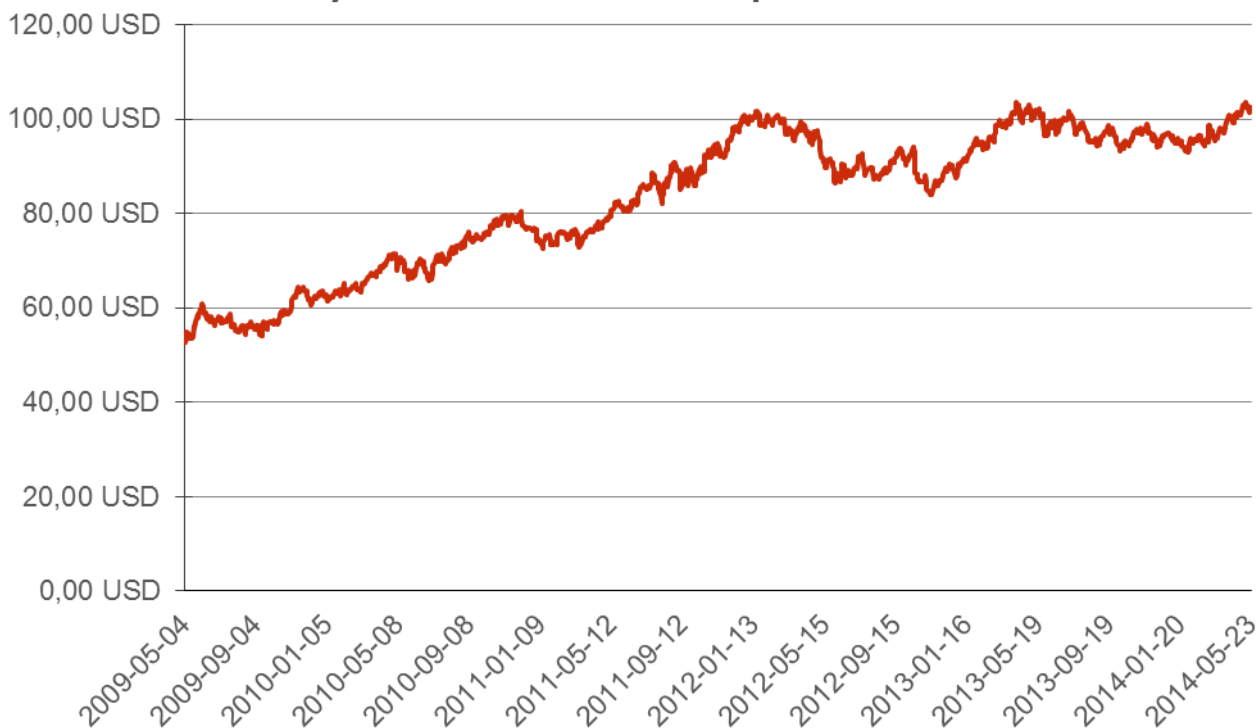
Wykres cen McDonald's Corporation od dnia 04.05.2009 r.

Według szacunków analityków w 2014 roku spółka osiągnie przychód na poziomie 29 mld USD oraz zysk netto 5,7 mld USD.