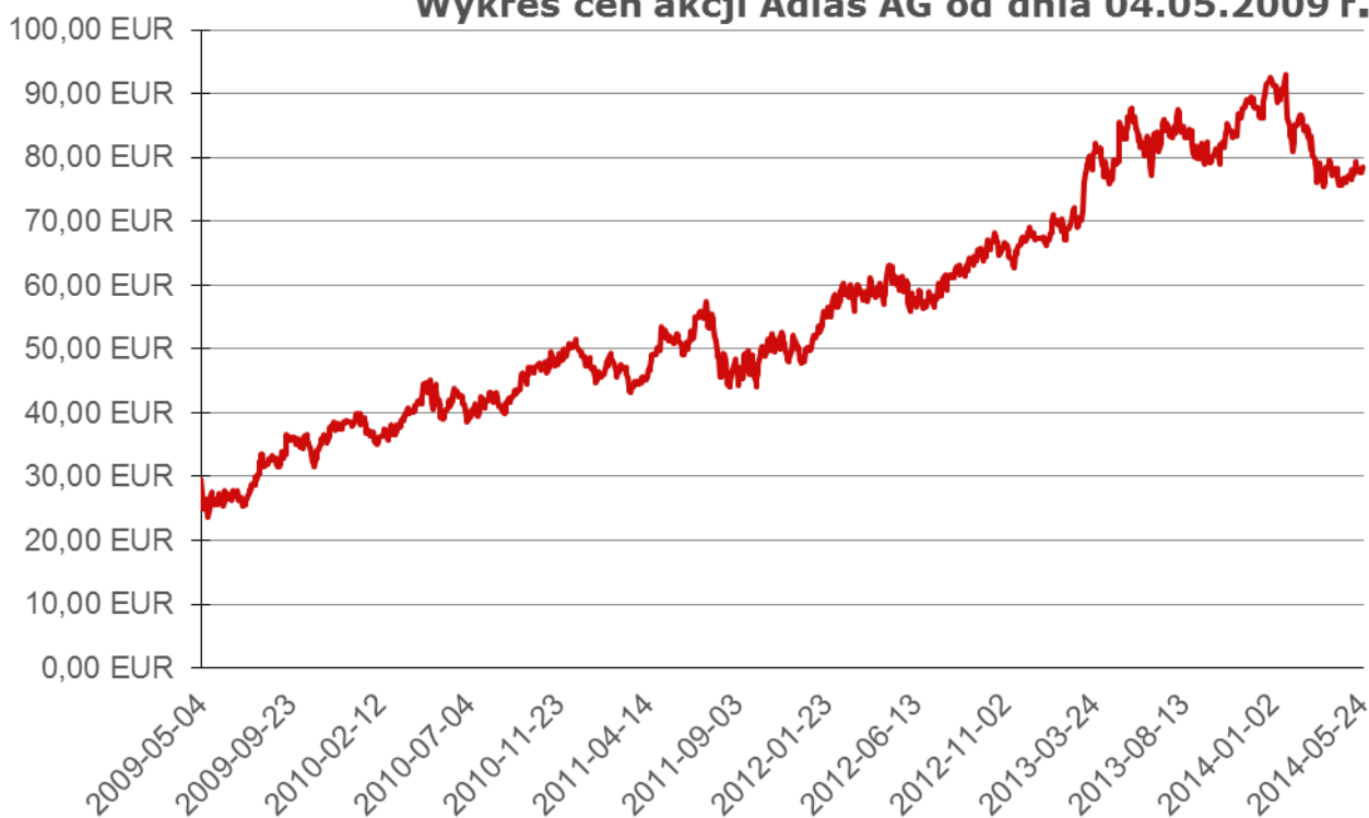
Wykres cen akcji Adidas AG od dnia 04.05.2009 r.

Według szacunków analityków w 2014 roku spółka osiągnie przychód na poziomie 14,8 mld EUR oraz zysk netto 889 mln EUR.