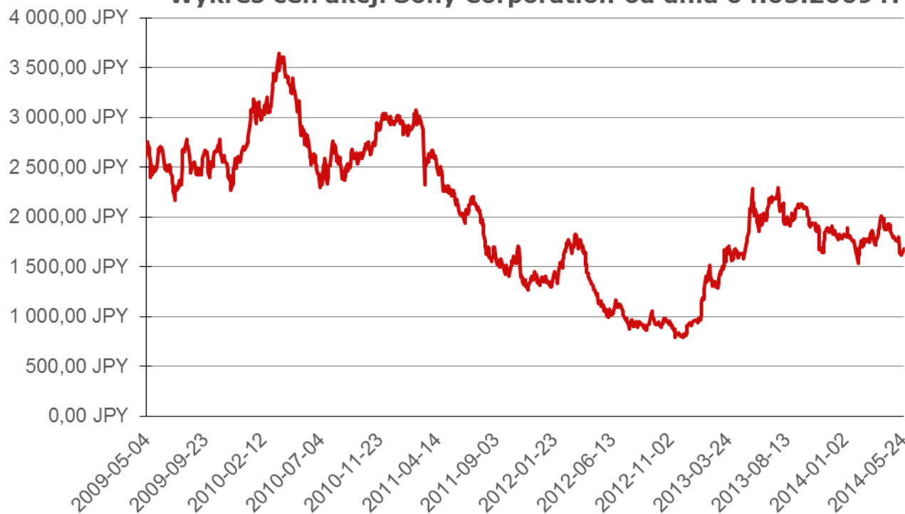
Wykres cen akcji Sony Corporation od dnia 04.05.2009 r.

Według szacunków analityków w roku finansowym 2015 (kończącym się 31.03.2015 r.) spółka osiągnie przychód na poziomie 7,8 mld USD oraz zysk netto 40 mln USD.