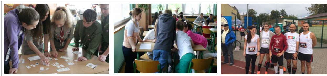
Fot.(od lewej):1. Zuchowie i harcerze z Tomaszowa Lubelskiego podczas warsztatów o tematyce oszczędzania, planowania wydatków i bankowości; 2. Podopieczni Domu Dziecka nr 2 w Warszawie podczas lekcji finansów; 3. Pracownicy mBanku przed startem w maratonie.

„ Biegnijmy razem dla innych ” to inicjatywa powstała w 2013 roku na prośbę pracowników mBanku, którzy chcieli połączyć pasję do biegania z pomocą potrzebującym. Każdy przebiegnięty kilometr owocuje przekazaniem przez mFundację darowizny na wsparcie celu społecznego wskazanego przez biegaczy. W 2015 roku, w ramach programu mFundacja przekazała darowizny o łącznej wysokości 25 911 zł na rzecz leczenia i rehabilitacji dzieci i dorosłych, podopiecznych specjalistycznych fundacji.