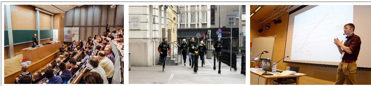
Fot. (od lewej): 1. Wykład podczas „Dnia popularyzacji matematyki” na Wydziale MiNI Politechniki Warszawskiej 2. Gra Miejska „Matematrix” – drużyna biegnie po zwycięstwo 3. Konferencja TriMat w Gdyni – licealista prowadzi wykład dla swoich rówieśników.