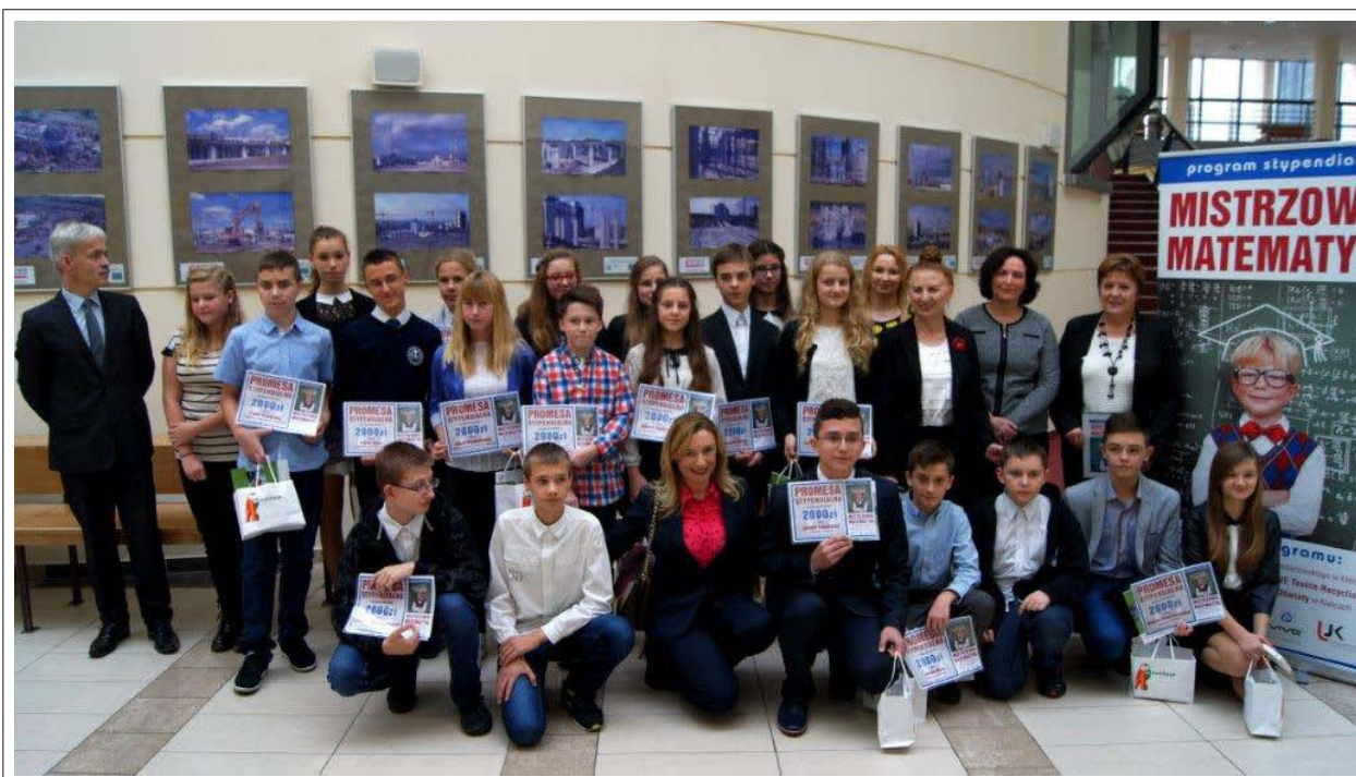
Fot. Stypendyści programu „Mistrzowie matematyki” realizowanego przez Fundację VIVE „Serce dzieciom” podczas wręczenia promes stypendialnych.

Jednym z beneficjentów programu była Fundacja VIVE „Serce dzieciom”. Do realizowanego przez nią programu mogli zgłaszać się uczniowie pierwszych klas gimnazjum z województwa świętokrzyskiego. Stypendia w wysokości 2 tys. zł każde otrzymało 20 uczniów osiągających wybitne wyniki z matematyki. Wielu z nich może się poszczycić nie tylko celującymi ocenami na świadectwie, ale także wieloma sukcesami w regionalnych i ogólnopolskich konkursach matematycznych. Przy realizacji programu Fundacja VIVE podjęła współpracę z Instytutem Matematyki Uniwersytetu Jana Kochanowskiego w Kielcach. Studenci Wydziału Matematyczno-Przyrodniczego UJK organizują cykliczne spotkania, podczas których stypendyści mogą zintegrować się i pogłębić wiedzę matematyczną.