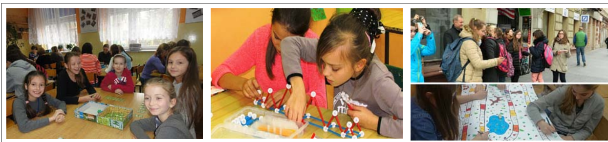
Fot. (od lewej): 1. Szkoła Podstawowa w Wielkim Rychnowie, projekt „Grająca szafa”; 2. Szkoła Podstawowa w Bieganowie, projekt „Bieganinki bawią się matematyką”; 3. Zespół Szkół Ogólnokształcących nr 7 w Łodzi, projekt „Matematyka da się lubić”