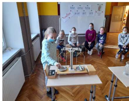
Od lewej: Szkoła Podstawowa im. gen Józefa Bema w Suszu; Szkoła Podstawowa w Dzięgielowie