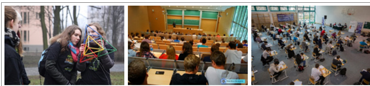
Fot. (od lewej): 1. Uczestnicy łódzkiej edycji gry miejskiej „Matematrix”; 2. II Dzień Popularyzacji Matematyki na Politechnice Warszawskiej; 3. XI Olimpiada Matematyczna Gimnazjalistów