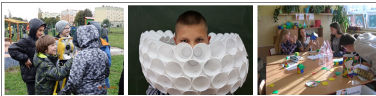
Fot. (od lewej): 1. Szkoła Podstawowa z Oddziałami Integracyjnymi nr 10 im. Polonii w Słupsku; 2. Szkoła Podstawowa nr 14 im. Kawalerów Orderu Uśmiechu w Rudzie Śląskiej; 3. Gimnazjum nr 23 z Oddziałami Integracyjnymi im. Ratowników Górskich w Katowicach

W 2016 roku mBank otrzymał za program grantowy „mPotęga” nagrodę Złotego Bankiera w kategorii „Bank wrażliwy społecznie.”