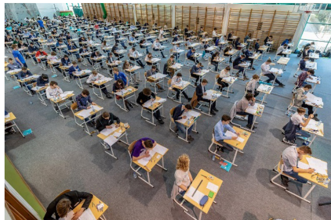
Na zdjęciach, od lewej: laureaci Olimpiady Matematycznej Juniorów (OMJ) otrzymują promesy stypendialne od mFundacji; XV Finał OMJ w Warszawie.